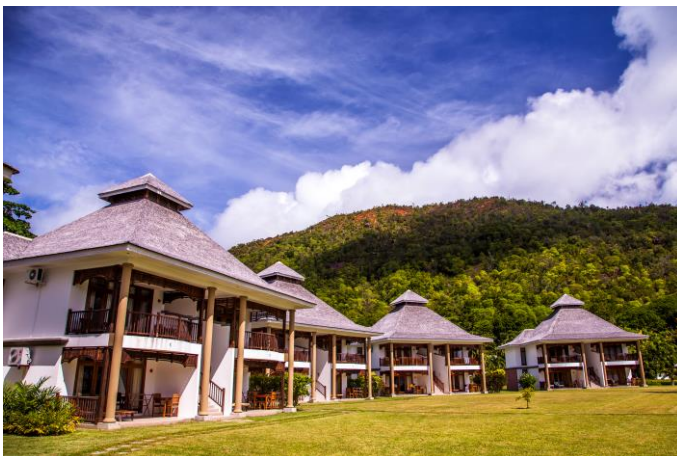
Deluxe Beachfront Bungalows

Das Domaine de La Reserve liegt in einer bezaubernden Ecke im Nord-Osten der Insel Praslin - an der Anse Petite Cour - an einem weissen Sandstrand, eingerahmt von Granitfelsen, gegenüber der Insel Curieuse. Das ist die ideale Umgebung für einen genussvollen Badeurlaub. Das Hotel liegt in einem geschützten National-Marine-Park von Praslin. Entfernung vom Flughafen – 16km / Anse Lazio – 4km / Vallée de Mai – 6 km Das Dorf von Sainte Anne liegt 3km entfernt; der Cote d' Or Strand in 5 Minuten zu Fuß erreichbar.