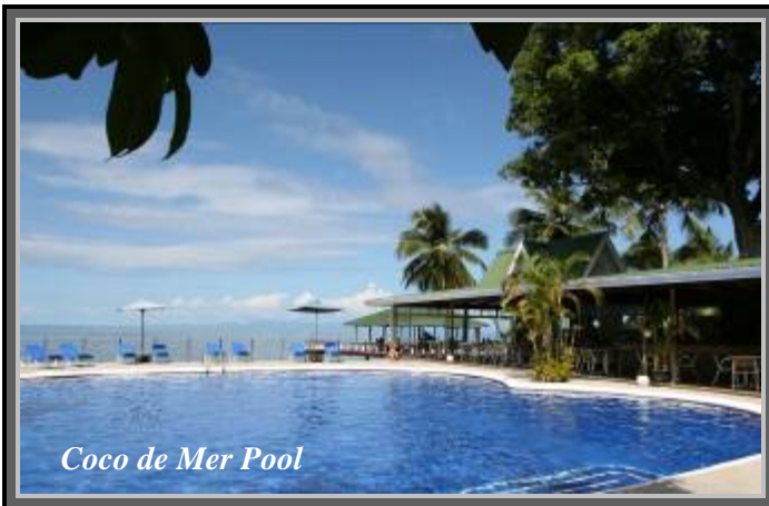
Coco de Mer Pool