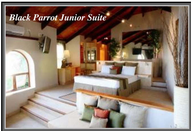
Black Parrot Junior Suite